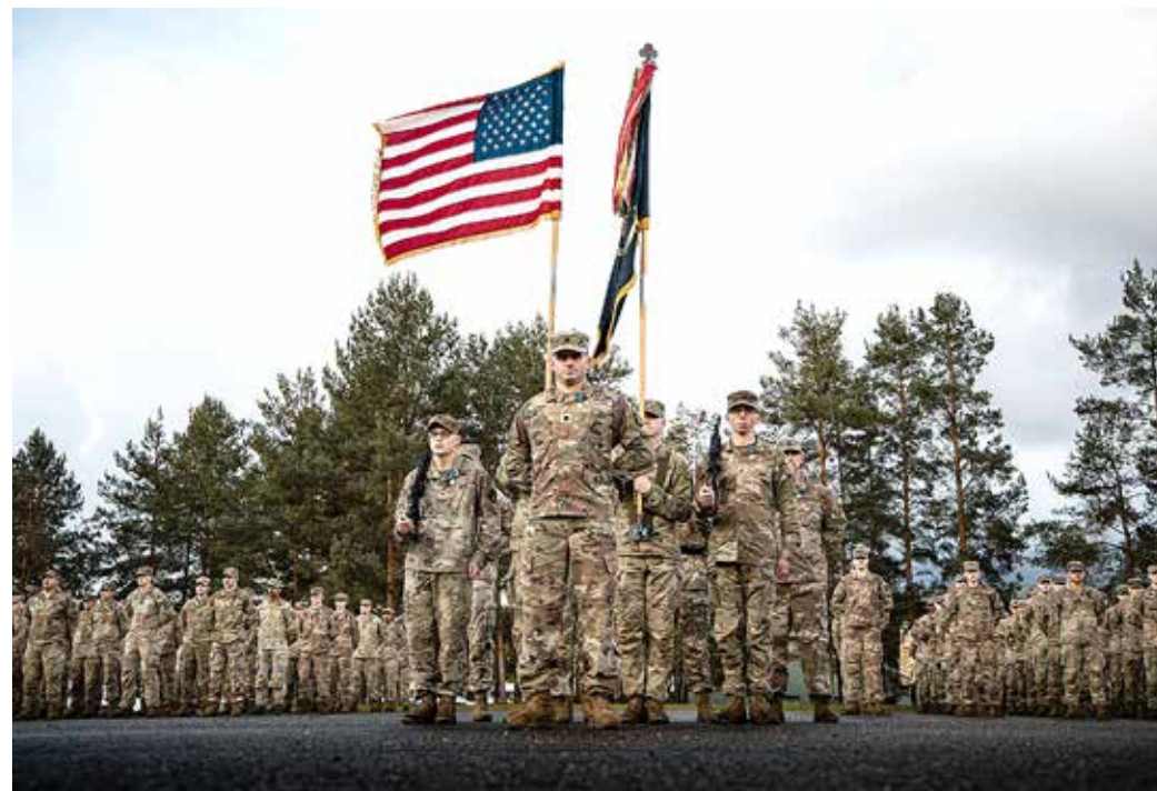
USA liitlaste medalitseremoonia Võrus.

Viimased paar aastat on olnud NATO jaoks muutuste aastad. 2022. aastal Madridi tippkohtumisel vastu võetud NATO strateegiline konseptsioon ütleb, et Venemaa Föderatsioon kujutab endast kõige ohtulisemat ja otsesemat ohtu liitlaste julgeolekule ning NATO jätkab oma poliitilist ja sõjalist arengut, et tagada liitlaste turvalisus ning sõjaline kaitse. NATO staabielelemendi jaoks töö see kaasa ülemineku kirdekorpusse alluvusest Brunsummi ühendlogistikajate ja toetusgrupi staabi alluvusse käesoleva aasta 1. jaanuarist. Staabielelementide peamised ülesanded jäid muutumata, mis vahendab infot ning olukorrateadlikkust NATO ja Eesti vahel, siis on üks väga tähtis ülesanne NATO kaitseplaanidesse panustamine. Staabielelemendil on oluline roll NATO kaitseplaanide rakendamise ja teostatavuse tagamisel.