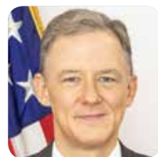
GEORGE P. KENT USA suursaadik Eestis

2024. aastal möödub 75 aastat NATO loomisest ja 20 aastat Eesti liitumisest NATO-ga. Venemaa sõda Ukrainas ja tema ähvardav retoorika tõstavad esile Eesti tähtsust NATO-le ja NATO tähtsust Eestile. Liikmesriikide ühise julgeoleku käsitlus on Eesti julgeolekustrateegia keskmes ning Eesti on üha enam eeskujuks nii teistele liikmetele kui ka alliansiga liituda soovivatele riikidele – mis on pühendunud heidutuse ja kaitsetegevusele, panustades rohkem, kui on tema õiglane osa, ning julgustades teisi sama tegema.