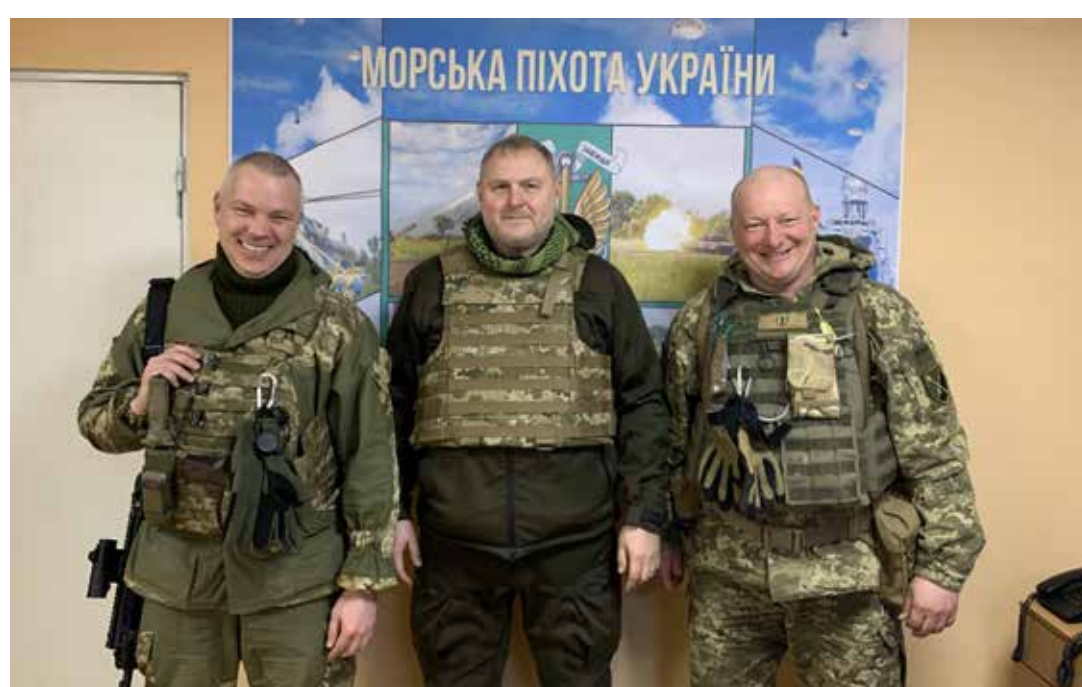
Riho Terras Ukrainas Vuhledaris veebruaris 2022.

2022 Madridi tippkohtumisel võttis NATO vastu uue kaitsekontseptsiooni, ettepaigutatud kaitse. Eesti mängis selle kontseptsiooni käivitamisel olulist rolli. Lisaks on Ukraina üks meie suurtest teemadest. Oleme pidevalt alla kriipsutanud, et ainult juhul, kui Ukraina sõja lõppedes NATOsse võetakse, saabub rahu Euroopasse. Vilniuse tippkohtumise otsustes peegeldub vastu liitlaste süvenev üksteisemõistmine selles küsimuses.