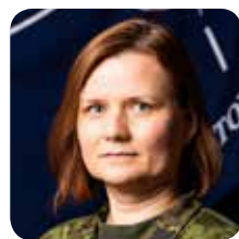
MERLE NORIT major, NATO staabielement

Praga kaheksas riigis (Eestis, Lätis, Leedus, Poolas, Ungaris, Slovakkias, Rumeenias ja Bulgaarias) asuvate NATO staabielelementide loomine otsustati 2014. aasta Walesi tippkohtumisel vastuseks muutunud julgeolekuolukorrale NATO idatiival. Mäletatavasti anneteerisid Venemaa Föderatsiooni relvajõud tol aastal Krimmi poolsaare ja osa Ida-Ukrainast.