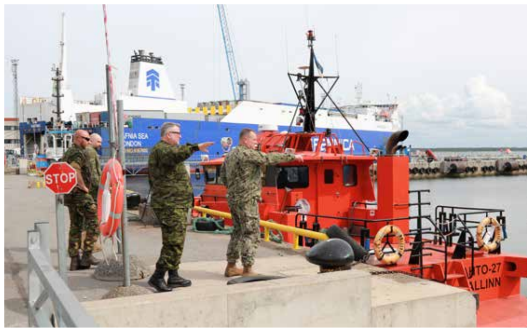
NATO staabielelemendi ning Brunsummi ühendlogistikajate ja toetusgrupi liikmed Paldiski Lõunasadamal võimekustega tutvumas.

Praga kaheksas riigis (Eestis, Lätis, Leedus, Poolas, Ungaris, Slovakkias, Rumeenias ja Bulgaarias) asuvate NATO staabielelementide loomine otsustati 2014. aasta Walesi tippkohtumisel vastuseks muutunud julgeolekuolukorrale NATO idatiival. Mäletatavasti anneteerisid Venemaa Föderatsiooni relvajõud tol aastal Krimmi poolsaare ja osa Ida-Ukrainast.